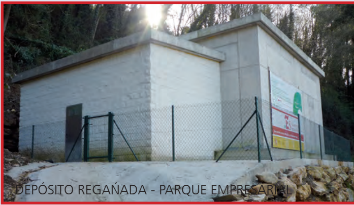
DEPÓSITO REGAÑADA - PARQUE EMPRESARIAL