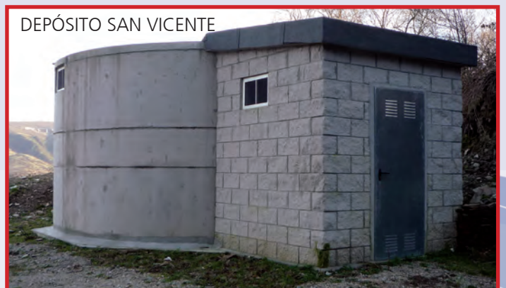
DEPÓSITO SAN VICENTE