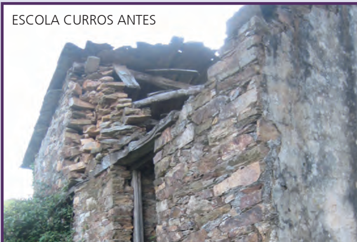
ESCOLA CURROS ANTES