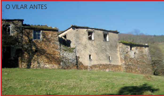
O VILAR ANTES