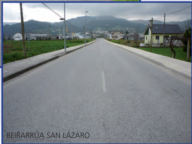
BEIRARRÚA SAN LÁZARO