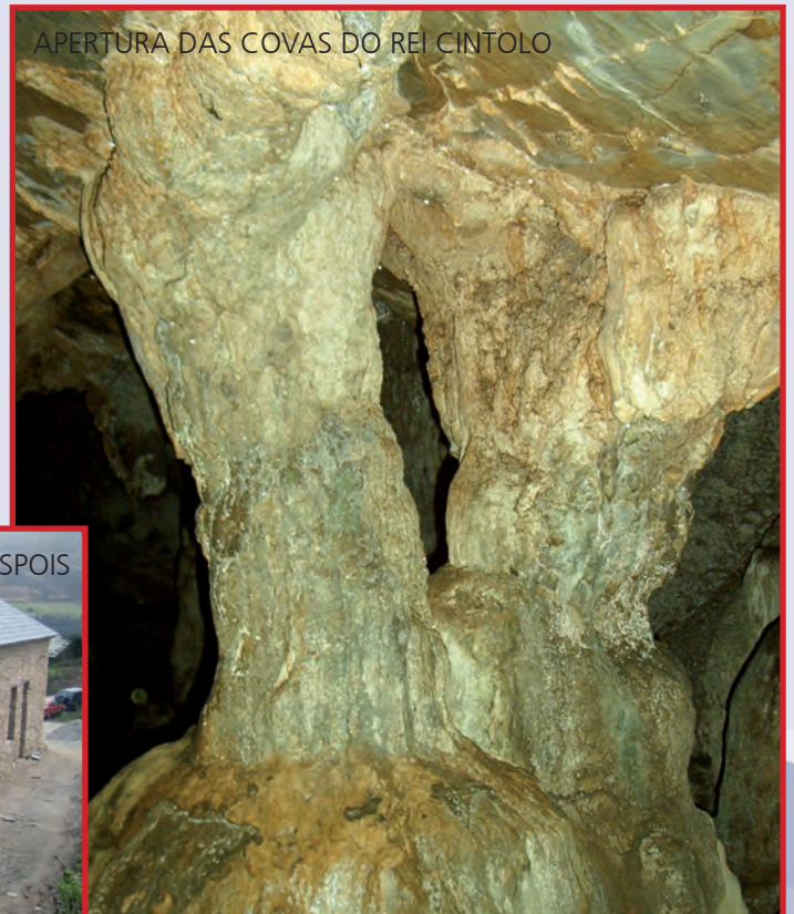
APERTURA DAS COVAS DO REI CINTOLO