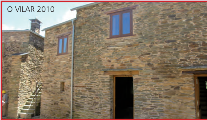
O VILAR 2010