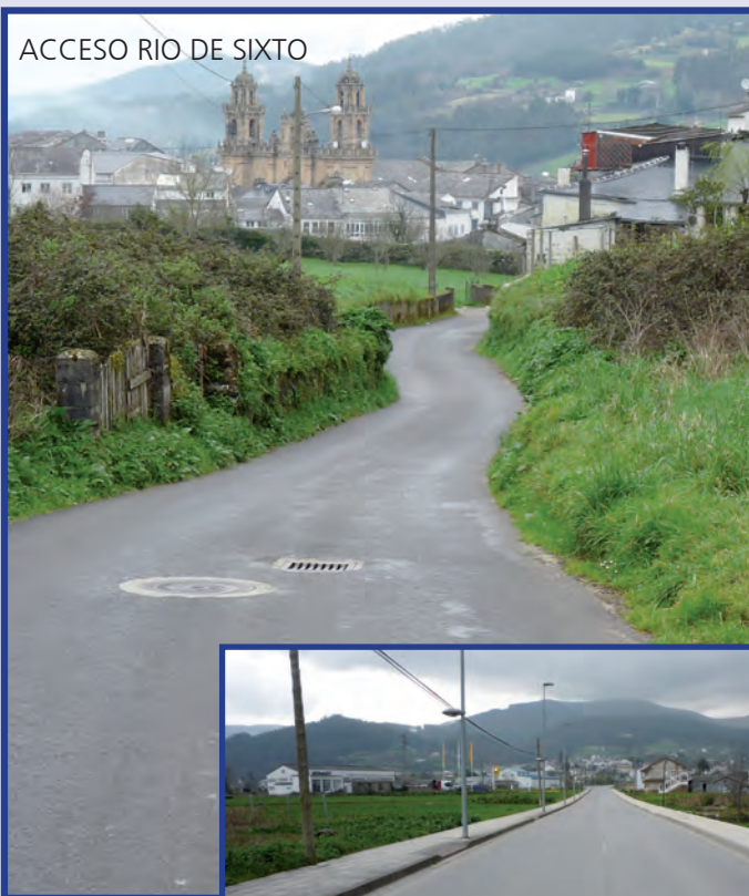
ACCESO RIO DE SIXTO