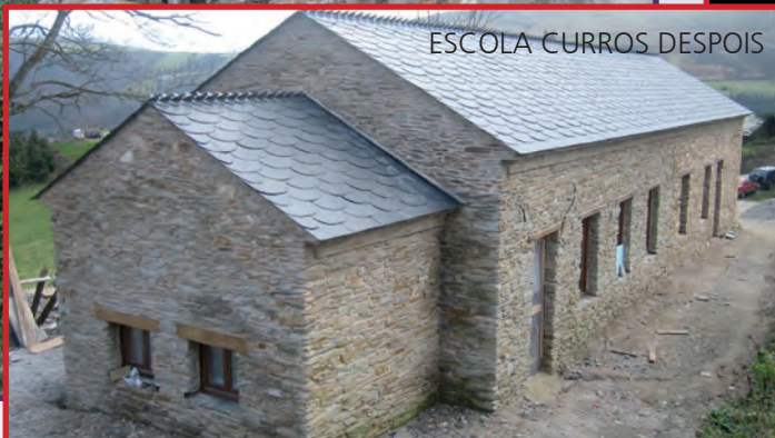
ESCOLA CURROS DESPOIS