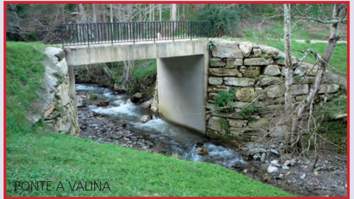
PONTE A VALIÑA