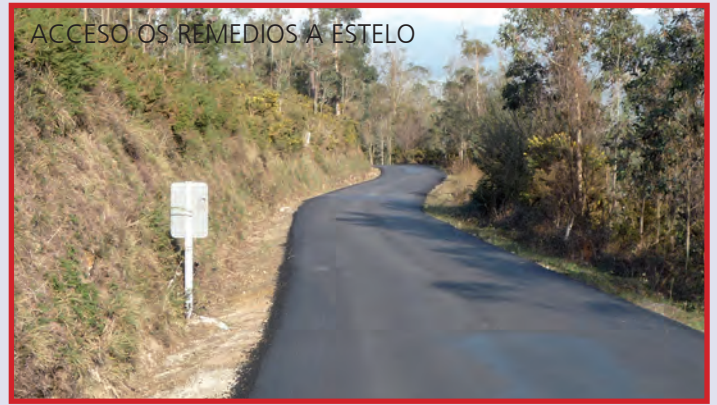
ACCESO OS REMEDIOS A ESTELO