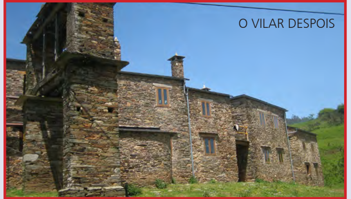
O VILAR DESPOIS