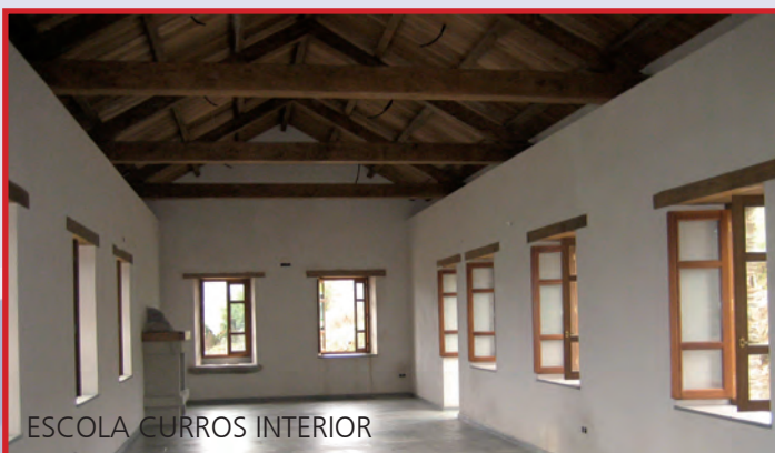
ESCOLA CURROS INTERIOR