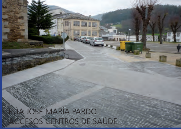
RUA JOSÉ MARÍA PARDO ACCESOS CENTROS DE SAÚDE