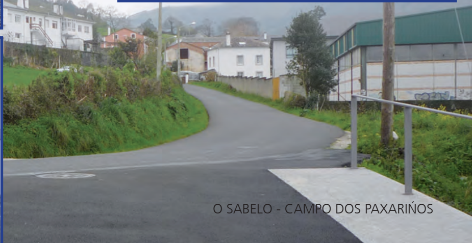
O SABELO - CAMPO DOS PAXARIÑOS